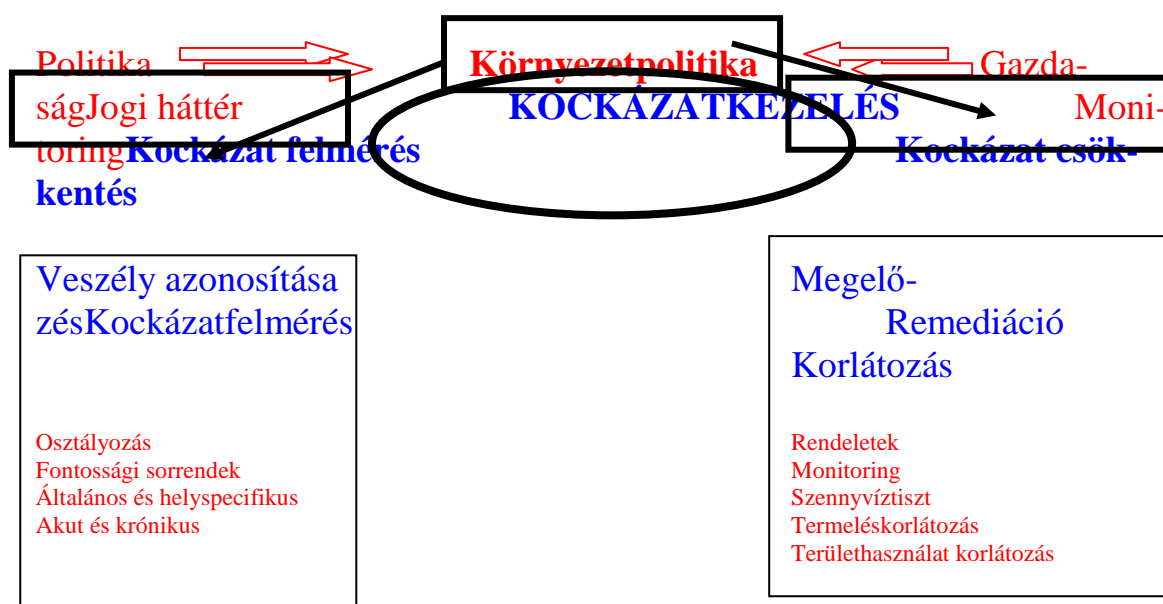
1. ábra: A környezetpolitika és a környezetmenedzsment feladatai öröklött szennyezett területek esetében

A kockázatmenedzsment a kockázat felméréseiből és a kockázat csökkentéséből tevődik össze. Összefüggéseit a környezetpolitikával az 1. ábrán láthatjuk.